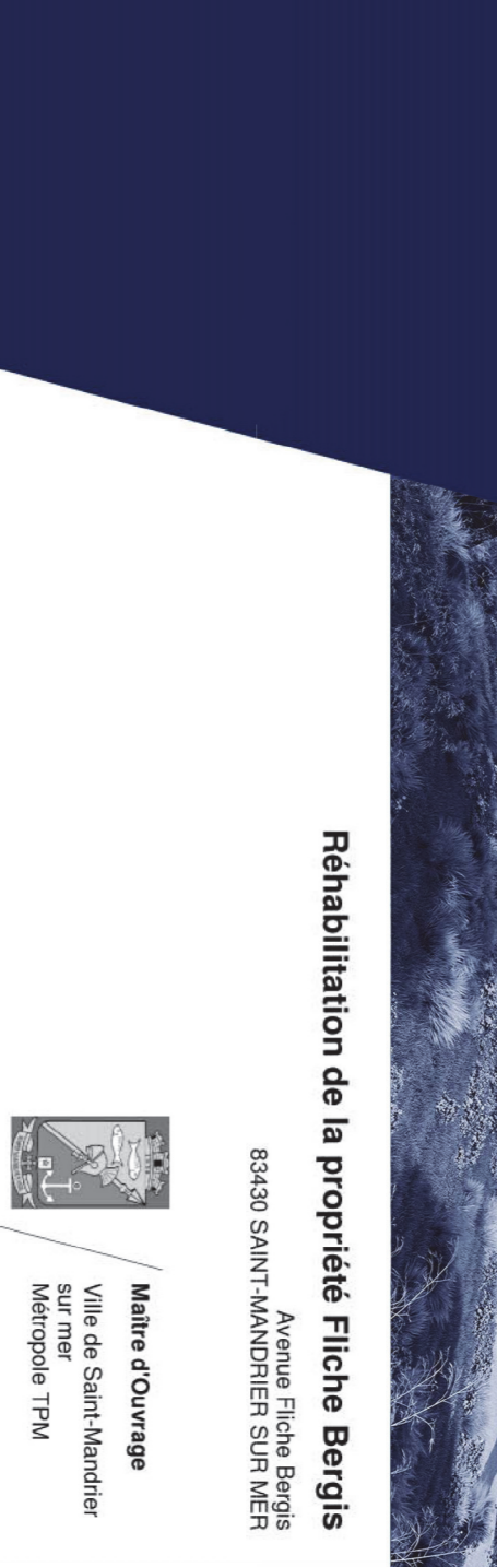
Réhabilitation de la propriété Filche Bergis