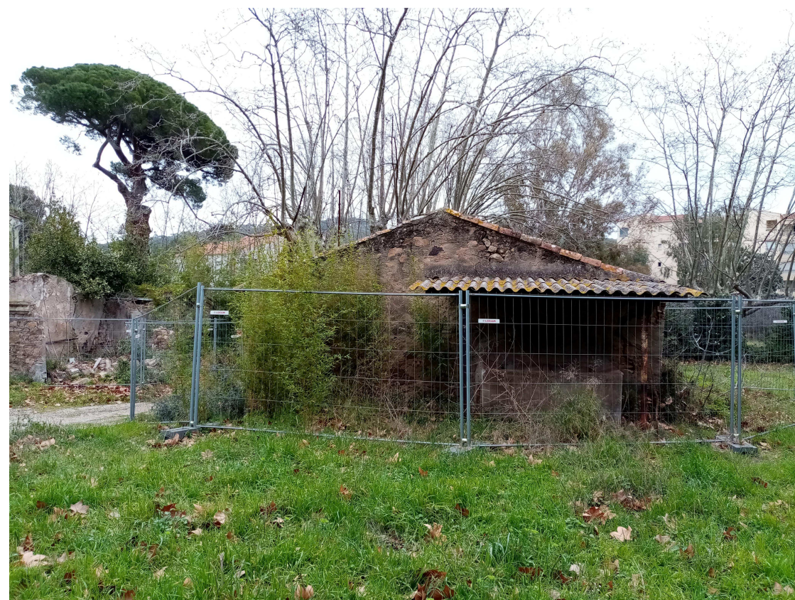
5_Garage à transformer en maison du gardien