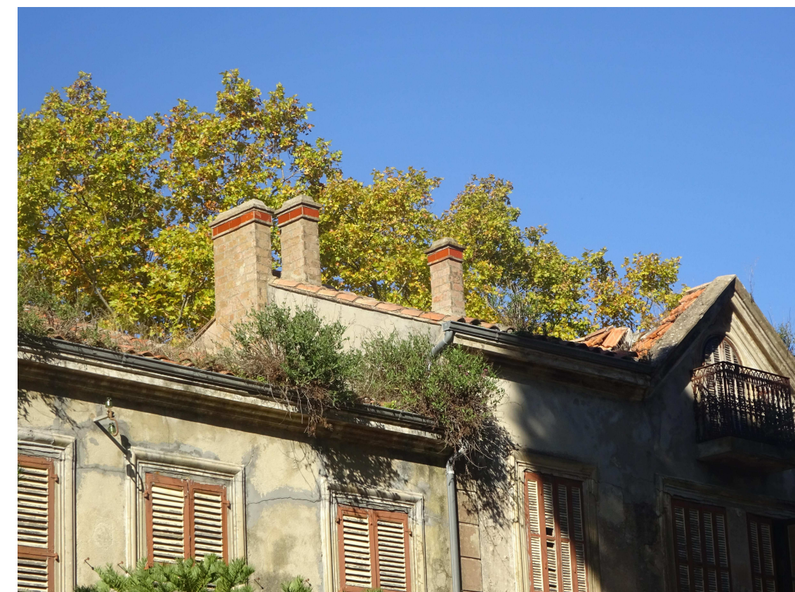
Toiture, souches, cheneaux en façade principale