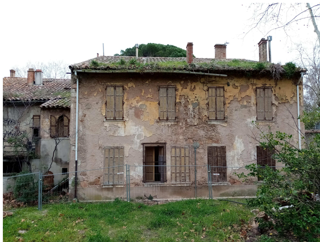
3_Façade Ouest ( arrière)