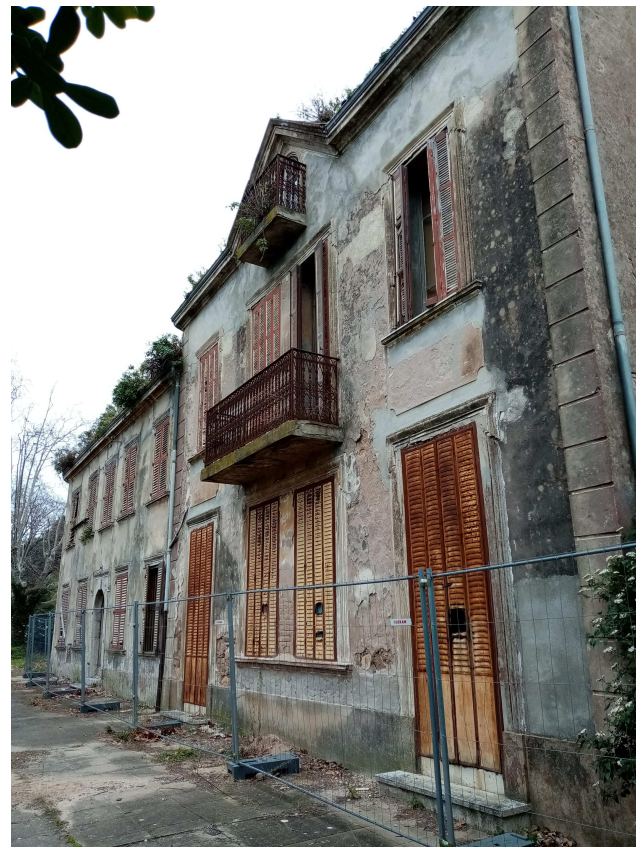
1_Façade Est (Principale)