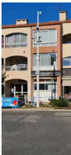
Rond-point G. Inaud