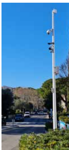
Vue vers sortie Pin Rolland