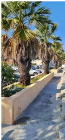
Jardinières parking Touring