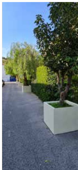
Jardinières rue des écoles