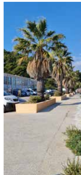
Jardinières parking de la Vieille