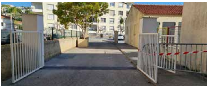
Rue des Écoles