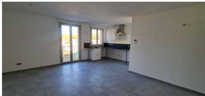
Logements sociaux de la Poste

Les travaux sont terminés. La réception a eu lieu le 9 novembre. Les deux appartements sont attribués et les personnes choisies entrent dans les lieux à partir du 1 er décembre. Coût de l'opération : 255 300 €.