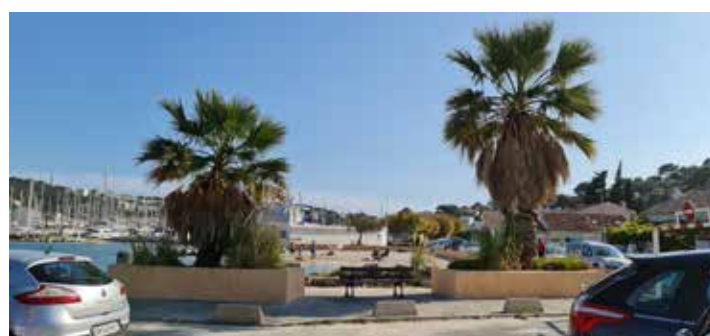
Jardinières parking Touring