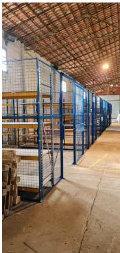
Salle Nachin : Réalisation d'un Aménagement. Montage de cellules permettant le rangement du matériel et son organisation par service.