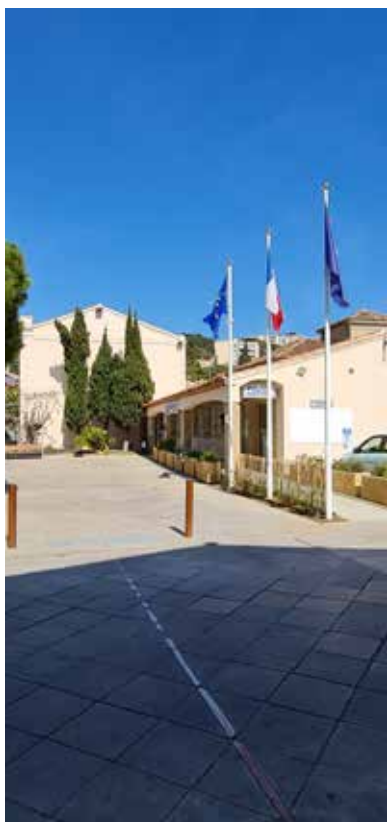
Mâts des pavillons : Déplacement des mâts qui étaient coincés dans les cyprès aux abords des locaux de la Police Municipale.