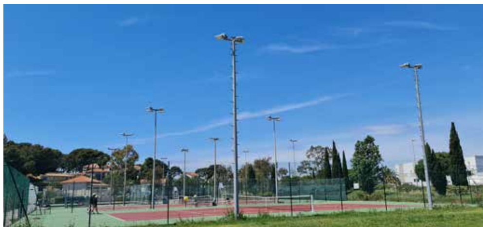
Tennis-Club : Dans le cadre des économies d'énergie, l'éclairage des courts a été remplacé par des projecteurs LED.