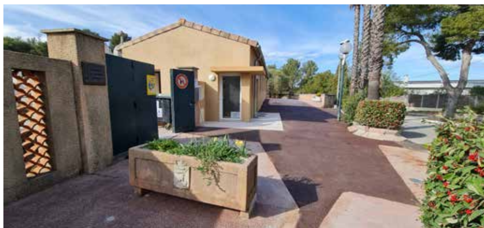
Logement du cimetière : Après de multiples difficultés rencontrées tout au long du chantier, le logement vient d'être attribué.