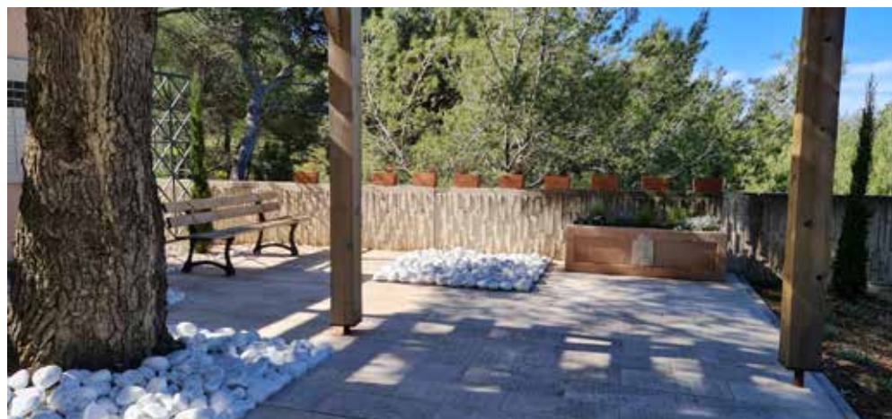
Jardin du souvenir : Suite à une demande justifiée, nos services ont effectué une rénovation complète de ce lieu de recueillement.