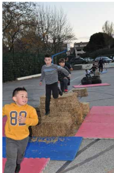
Parcours d'obstacle