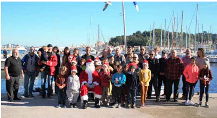
Le Père Noël entouré par les enfants, parents, amis et administrateurs du CNSM