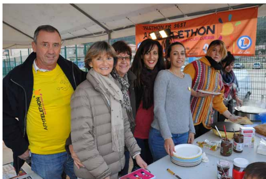
OMJS et Ti'Mandréens soudés pour le Téléthon - Photo © L. Fournié