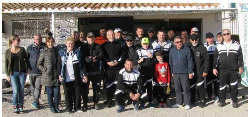
Les Boulomanes du Creux