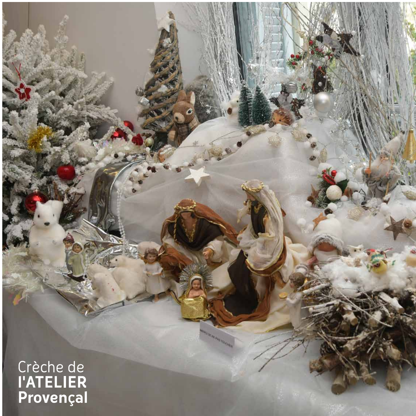
Crèche de l'ATELIER Provençal