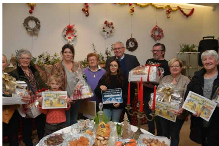
Quelques lauréats pour la traditionnelle photo des récompenses