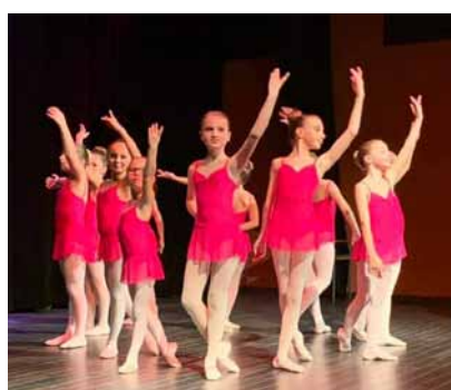
L'École de danse