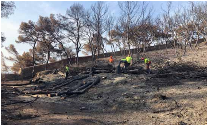
EVEA au travail

Ainsi, dès le lendemain du sinistre, le Président de la Métropole Hubert Falco et ses services nous ont débloqué une enveloppe de 90 000 € pour les travaux d'intervention en forêt et des moyens humains. Le Conservatoire du Littoral, quant à lui, a prévu de débloquer 140 000 € pour le remplacement de matériels et de travaux en forêt dans le secteur de l'Ermitage. L'Office National des Forêts, qui a fait un état des parcelles incendiées, a préconisé d'abattre les arbres rendus dangereux car atteints par le feu et de les envoyer à Gardanne pour être incinérés et ainsi fabriquer de l'électricité. Depuis le 7 Août, l'entreprise EVEA, choisie par la Métropole et le Conservatoire, s'affaire dans la forêt pour la sécuriser en abattant les arbres atteints par le feu et qui sont morts, et les préparer en vue de faire des fascines.