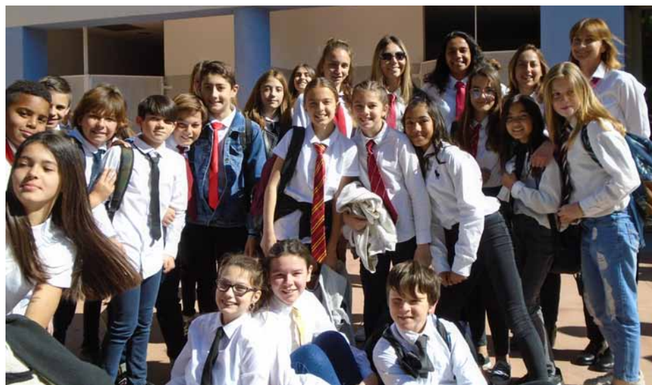
Le collège à l'heure britannique

Un beau moment de découverte culturelle, un grand merci à tous les participants, notamment la mairie et au restaurant scolaire, pour leur implication. À l'année prochaine !" ■