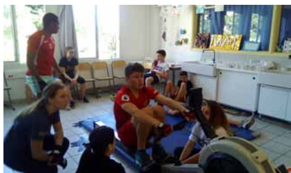
Élève sur rameur en plein record

Les 39 collégiens répartis en 3 groupes se relayant toutes les 2 h, très investis dans le projet, ont ramé du lundi 29 avril 10 h au mardi 30 avril 10 h non stop. Bravo à eux ! Enfin, une épreuve parallèle pour les sportifs handicapés membres de l'association RFCTPM a eu lieu afin de clôturer le challenge sportif « tous ensemble » et renforcer ainsi la cohésion et l'appartenance au même groupe. Une belle aventure et de belles rencontres formatrices pour les élèves. Ils répondront présents au défi l'année prochaine ! ■