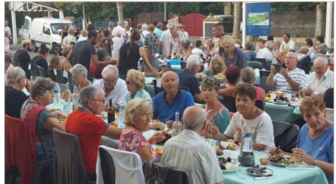
Aioli dansant du 23 juillet 2018 sur le parking Sainte Asile