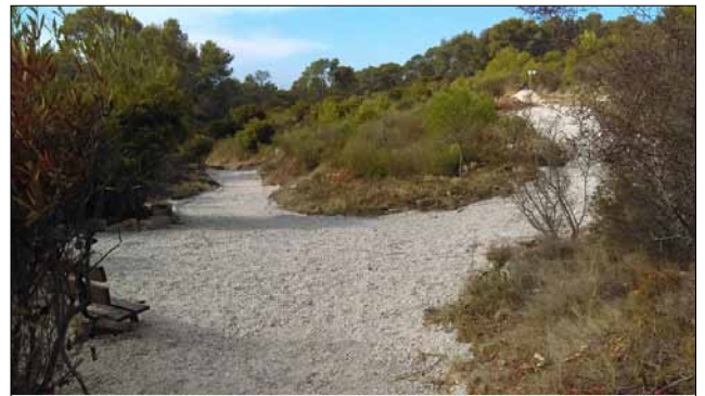
Le sentier sportif après...