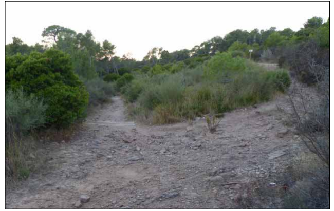
Le sentier sportif avant...

Aussi, n'hésitez pas à y faire une visite pour une promenade dès ce début d'année.