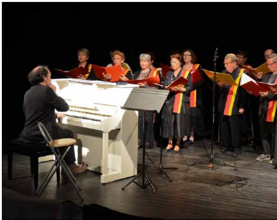
La Chorale Alléluia en concert au Théâtre Marc Baron