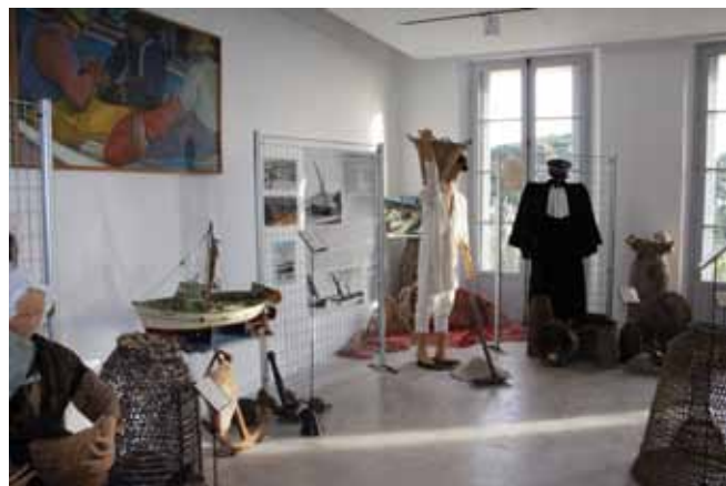
Ecomusée - Exposition sur la mer