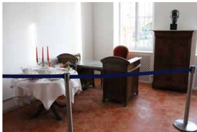
Bureau de Maître Juvénal