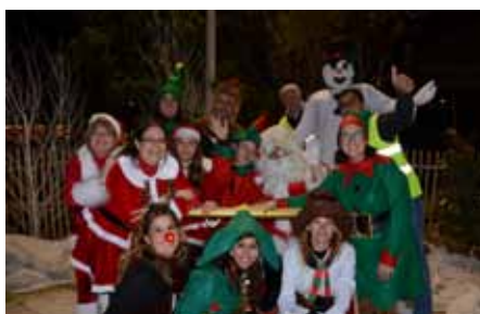
L'arrivée du Père Noël