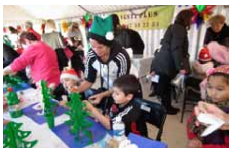
Les Ateliers de Noël