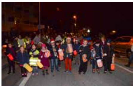
La marche des Lucioles