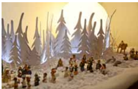
Concours de crèches