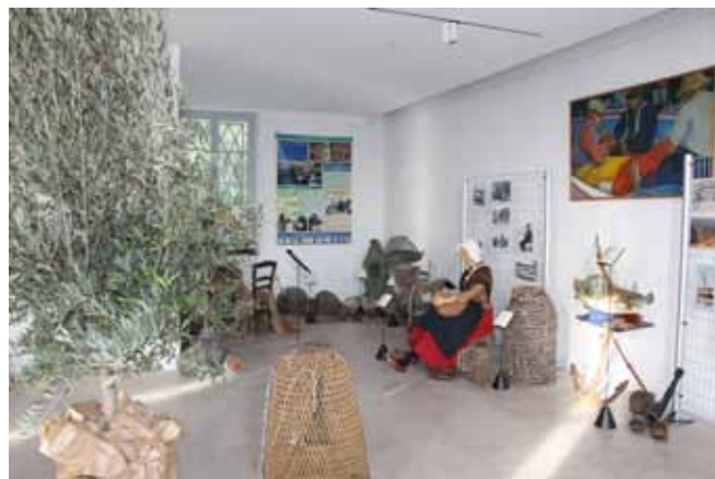
Ecomusée - Exposition sur l'olivier