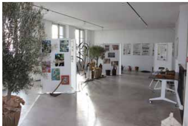
Ecomusée - Exposition sur l'olivier